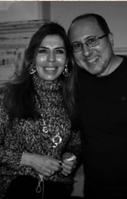
Día 7: Letras en la Panera