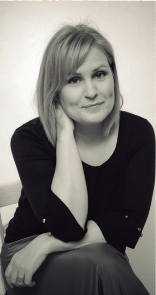
Día 14 Intervención en el homenaje a Luis Mateo Díez y José María Merino